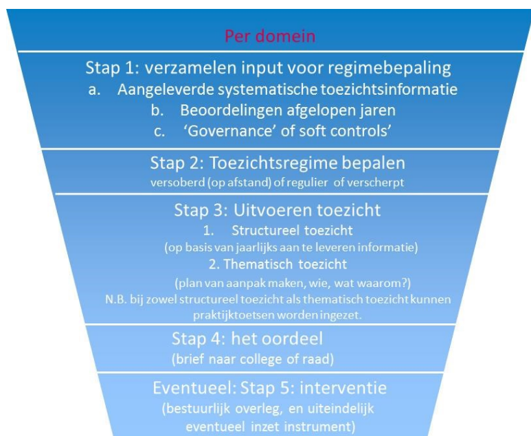
Figuur 2: 'De trechter', integrale werkwijze voor alle toezichtsdomeinen

In onderstaande figuur is onze integrale werkwijze gevisualiseerd.