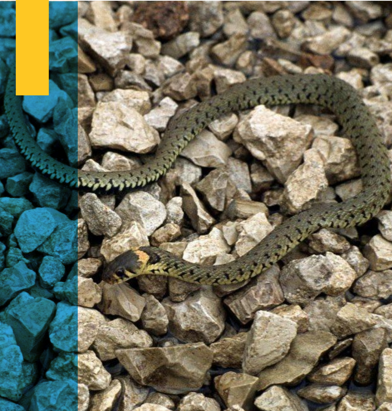
Onder meer de ringslang kan profiteren van de natuurontwikkeling