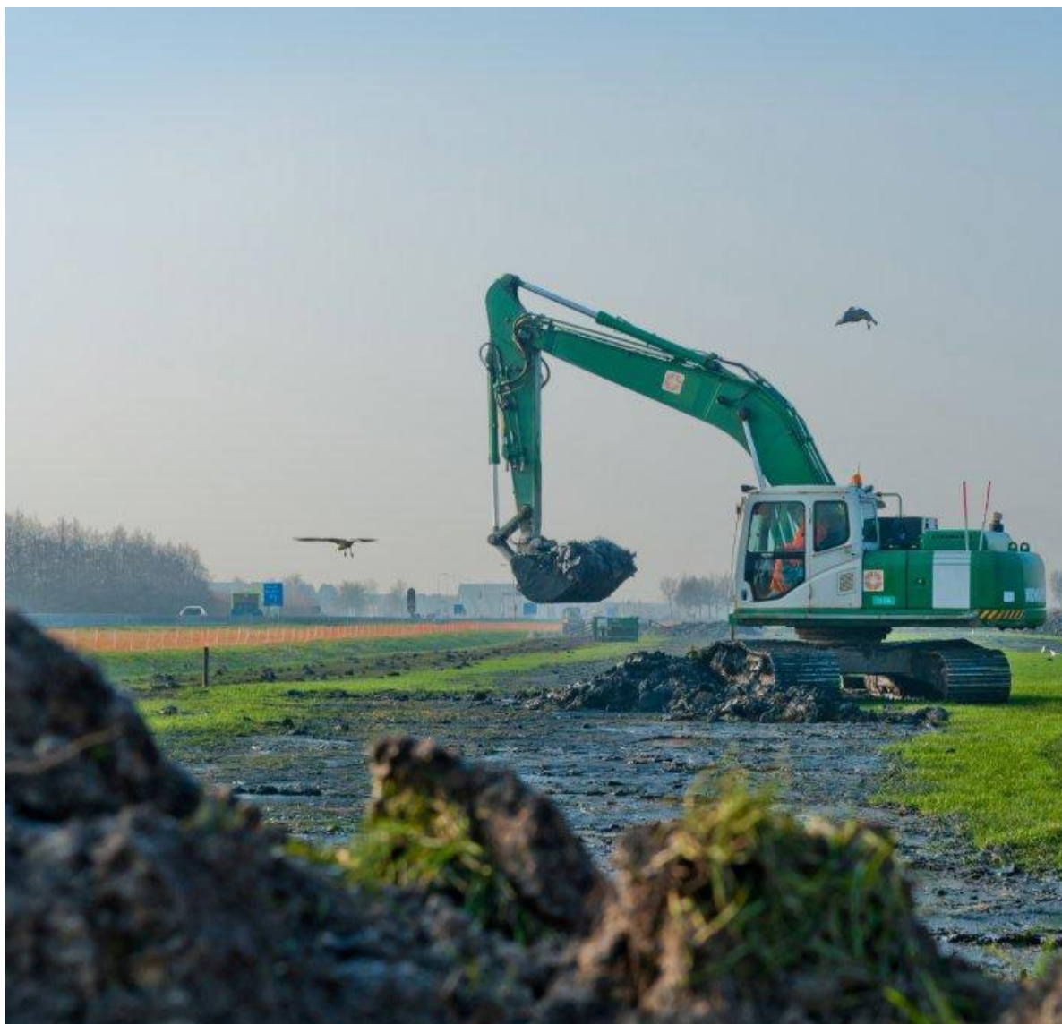
Grondwerkzaamheden N23 Westfrisiaweg