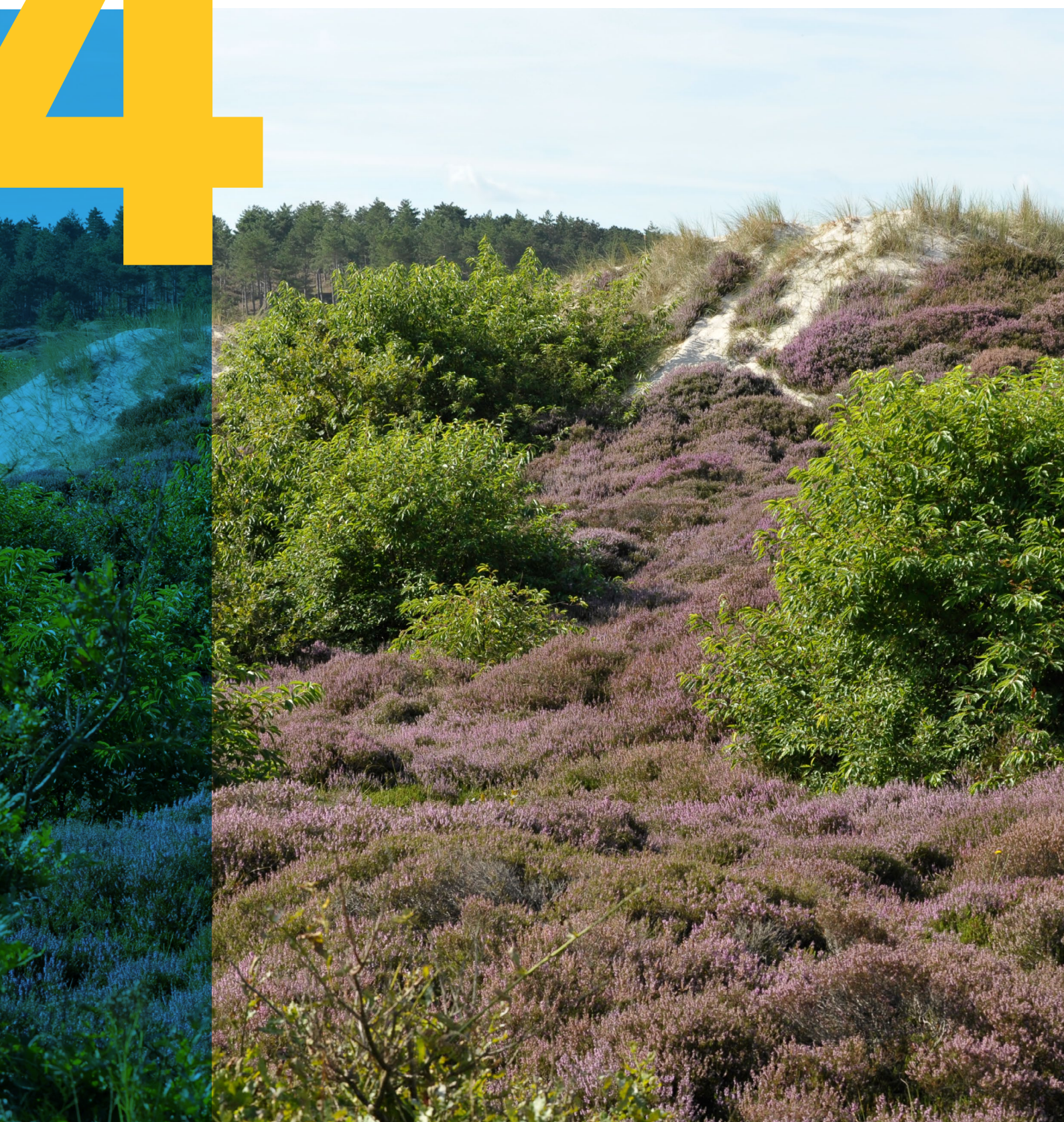
Duinen, Schoorl