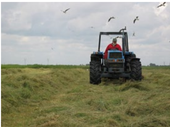
Door kavelruil worden agrarische percelen beter bereikbaar en is er minder landbouwverkeer op de openbare weg.

Als gevolg van de decentralisatie van het beleid voor natuur, recreatie en landschap, is er sinds 2011 veel veranderd in dit beleidsveld. De door Provinciale Staten aangenomen motie 53/2014 bevestigt dat natuurontwikkeling en -beheer een kerntaak is geworden van de provincie. De provincie heeft nieuwe taken en bevoegdheden overgedragen gekregen van het Rijk en binnen de provinciale begroting is 'groen', na 'verkeer & vervoer', de meest omvangrijke taak geworden. PS hebben GS gevraagd om de verantwoording over de 'groene kerntaak' zó vorm te geven, dat Provinciale Staten hier via de planning&control-cyclus goed sturing op kunnen geven. Aan motie 53/2014 is uitvoering gegeven doordat nu PS het Provinciaal Meerjarenprogramma Groen vaststellen. Daarnaast is het moment waarop het Provinciaal Meerjarenprogramma Groen wordt vastgesteld nu gekoppeld aan de provinciale planning&control-cyclus. Wij zullen in de ambtelijke voorbereiding op de Kaderbrief voor het Provinciaal Meerjarenprogramma Groen, een inschatting maken of de doelen kunnen worden gerealiseerd