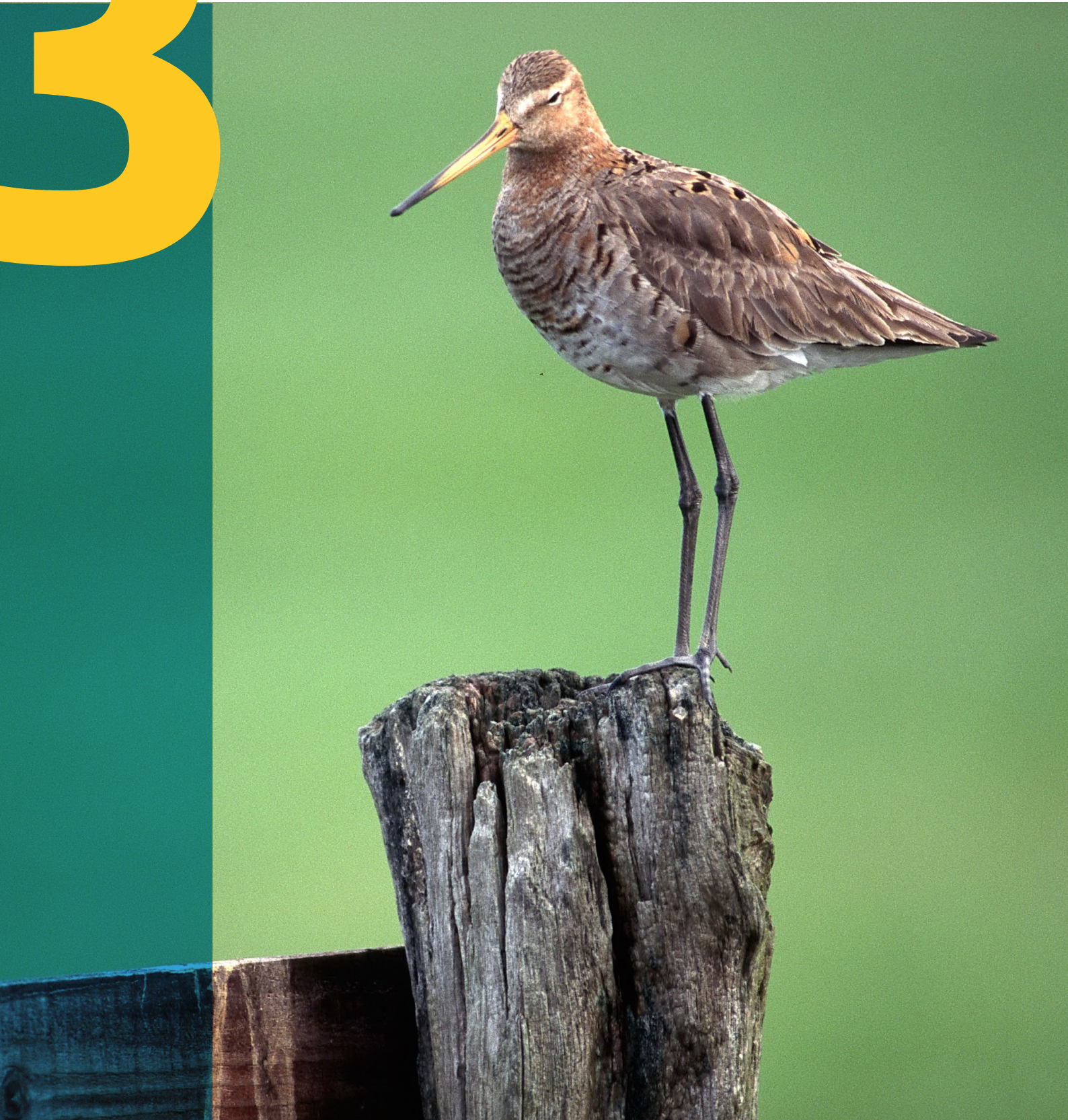
Onder meer de grutto komt voor in het weidevogelleefgebied