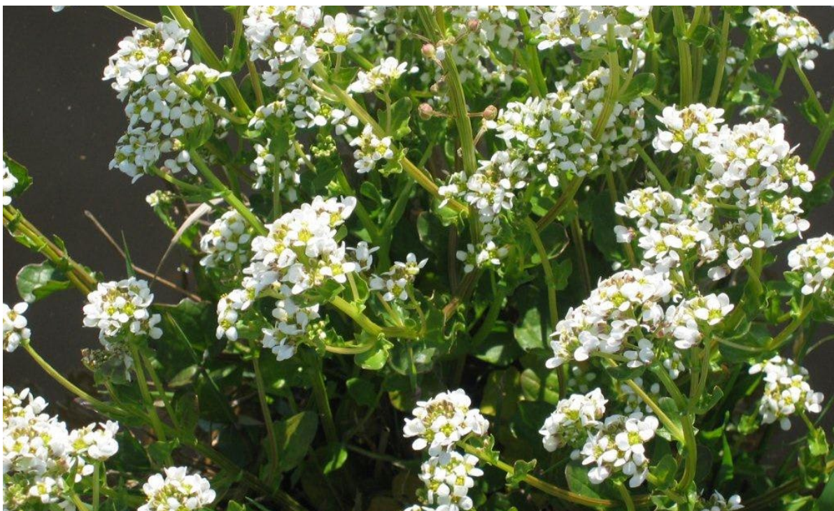
Echt Lepelblad