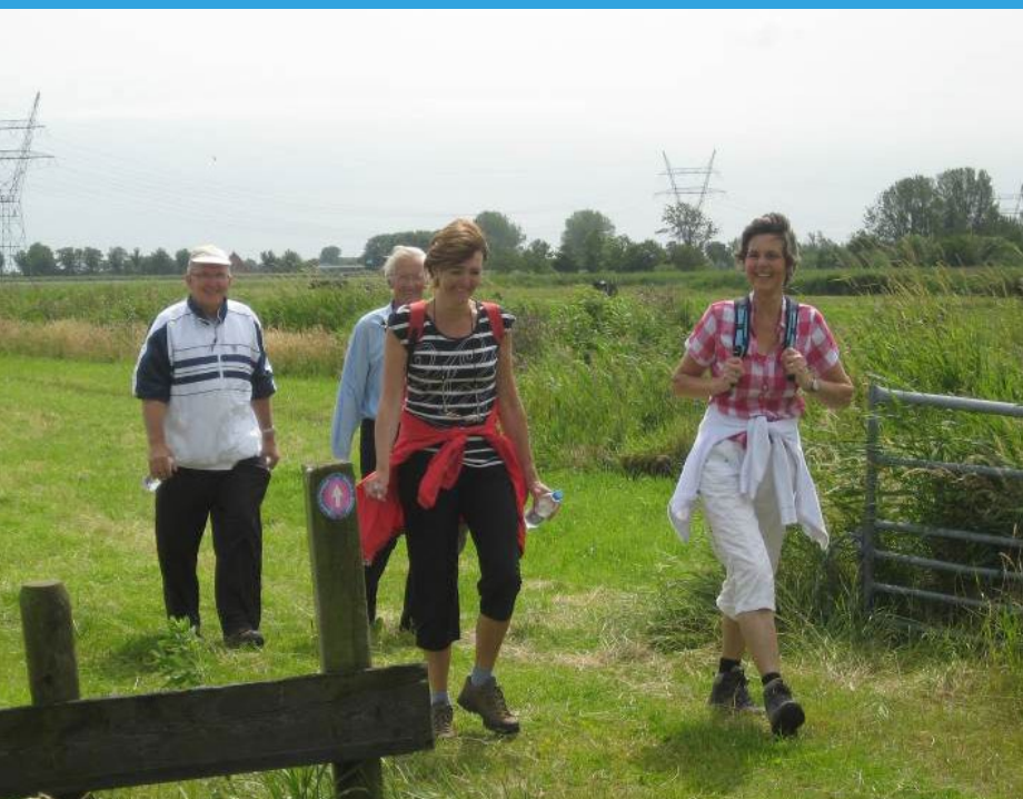
Wandelaars hebben straks meer mogelijkheden om te genieten van het landschap in Noord-Kennemerland