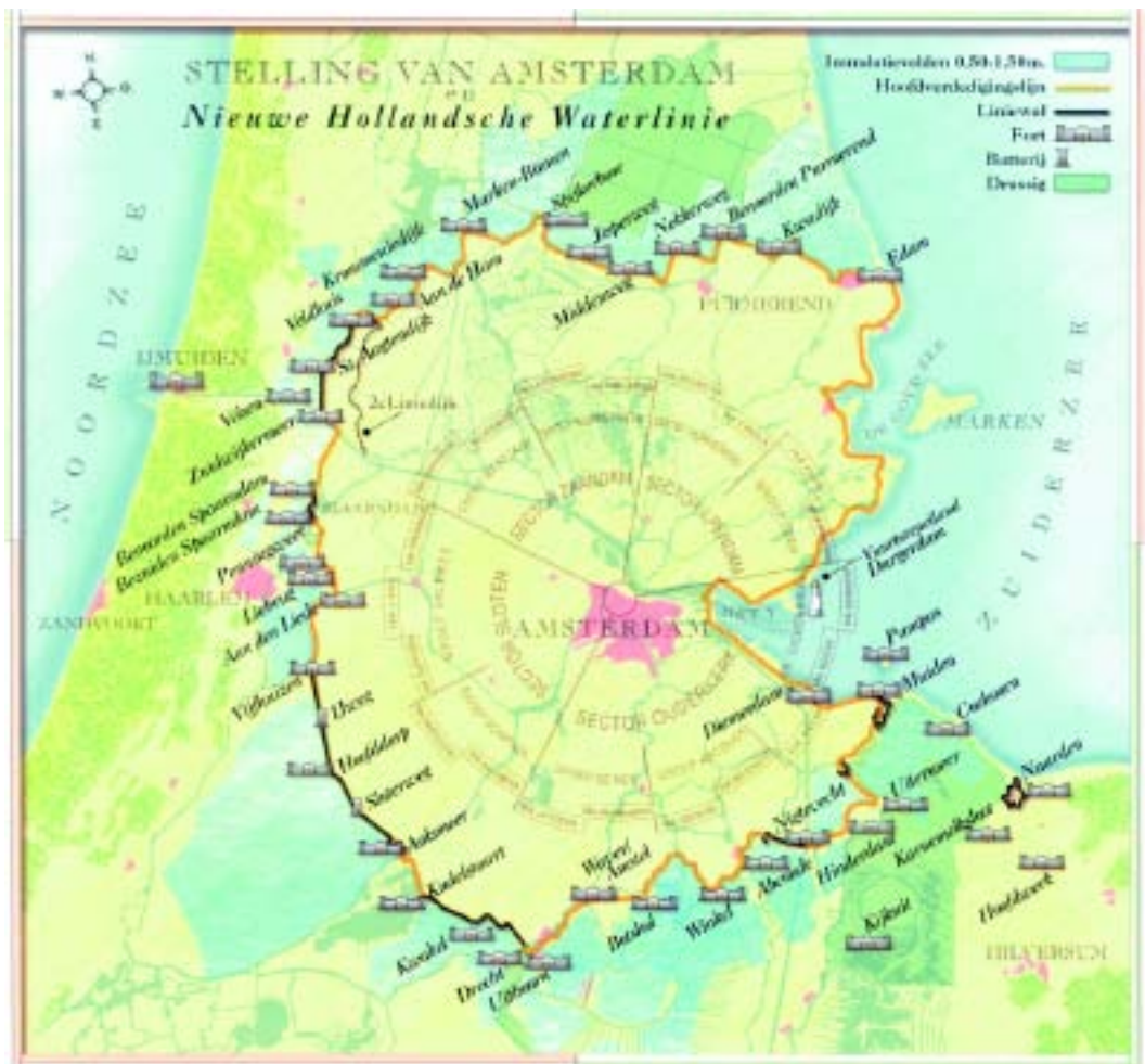
Fig. 2 De Stelling van Amsterdam

Om deze doelen te bereiken beoogt de Stelling van Amsterdam in 2020 de volgende resultaten te hebben bereikt: