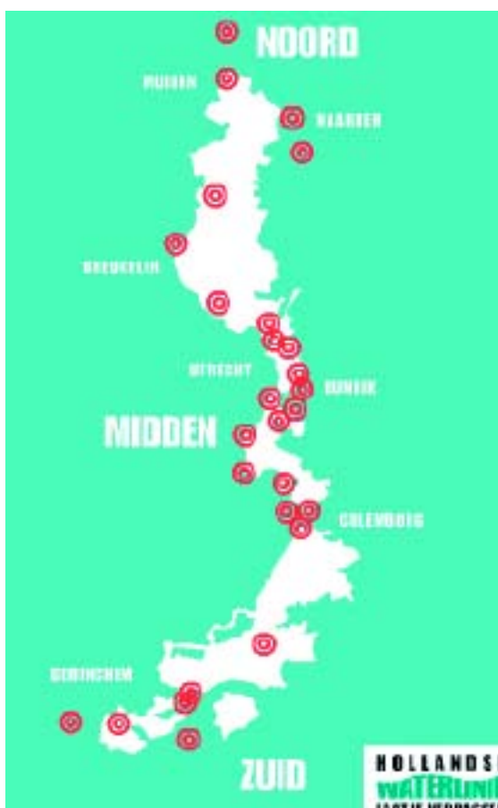
Fig 1 Nieuwe Hollandse Waterlinie

Nederland is beroemd om haar eeuwenlange strijd tegen het water. Echter, het water was ook een bondgenoot. In tijden van oorlog liet men opzettelijk land onder water lopen om de vijand tegen te houden. Een bekende Waterlinie in ons land is de Nieuwe Hollandse Waterlinie. Deze verdedigingslinie van 85 kilometer lengte loopt van de voormalige Zuiderzee bij Muiden tot aan de Biesbosch. Zij lag als een beschermende krans rondom de steden van Holland en Utrecht. De Waterlinie is drie tot vijf kilometer breed.